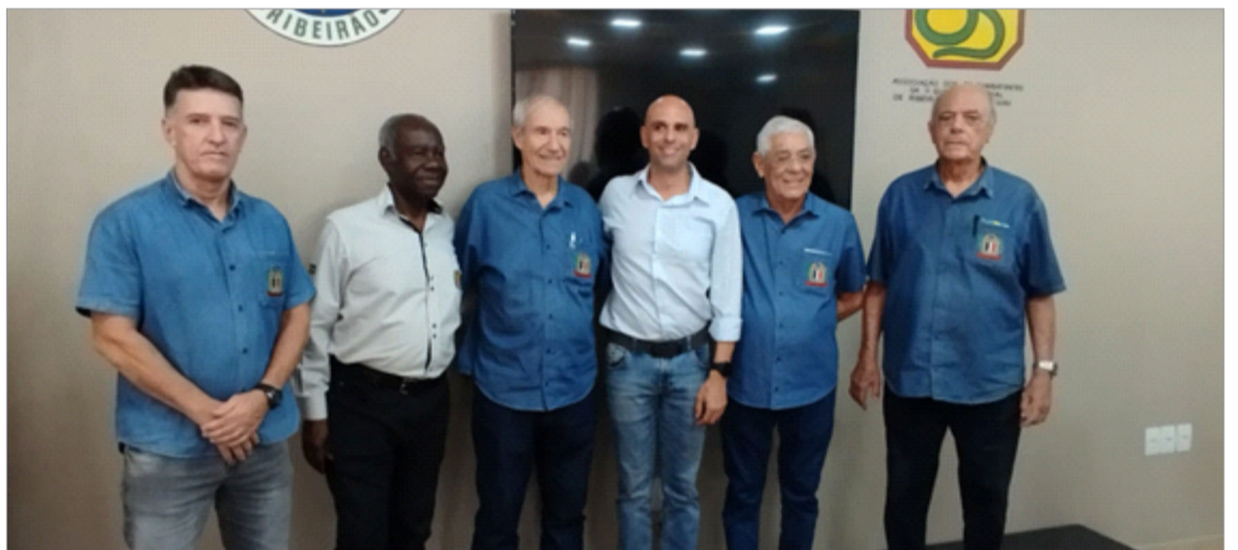
Comemoração 38º aniversário A.M.O.R